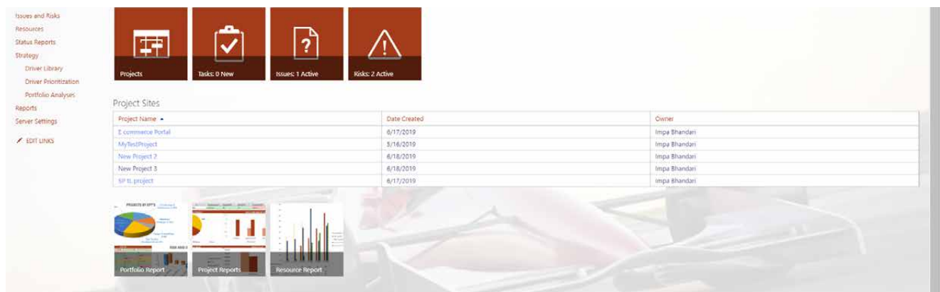
Bild: Dashboards und Drill-Down-Funktionen zur Identifikation von Auffälligkeiten im laufenden Portfolio.

Der Umstieg von dezentralen Verfahren auf ein unternehmensweit integriertes Projektmanagement bedeutet immer eine große Herausforderung. Das gilt sowohl für ein Unternehmen als Ganzes als auch für die einzelnen Mitarbeiter. Um diese Herausforderung zu bewältigen, hatte Hörmann Logistik eine klare Strategie.